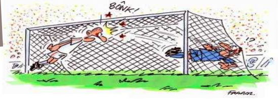
LE PLUS BEAU BUT DE ZIDANE : UNE MATERAZZA!

La France, réduite à 10 joueurs sur le terrain, ne réussit pas l'exploit tant attendu et s'inclina ensuite face au Italiens. Après cette défaite, tout le monde du football a cherché à savoir pourquoi le ballon d'or 2006 (Zidane) avait perdu son sang froid, et ce que lui aurait dit Materazzi.